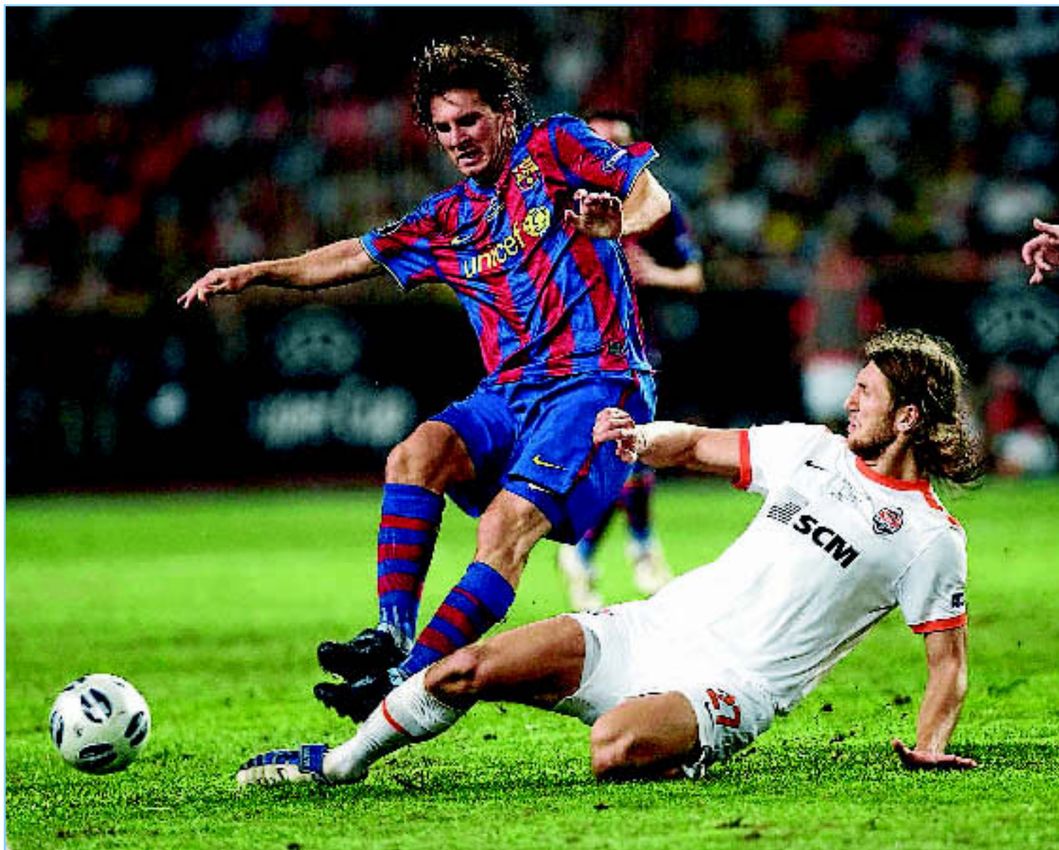
Messi se las tuvo con Chygrynskiy unos días antes de que sean compañeros de plantilla