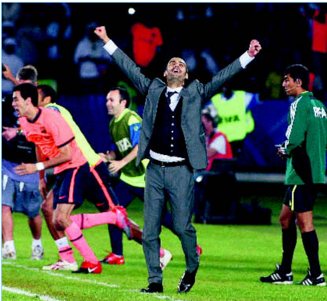
¡¡¡Siiiiiiiiiiii!!! Pep Guardiola ha entrado en la historia del fútbol

→ rez que le robó la cartera a una defensa blanda y adelantada.