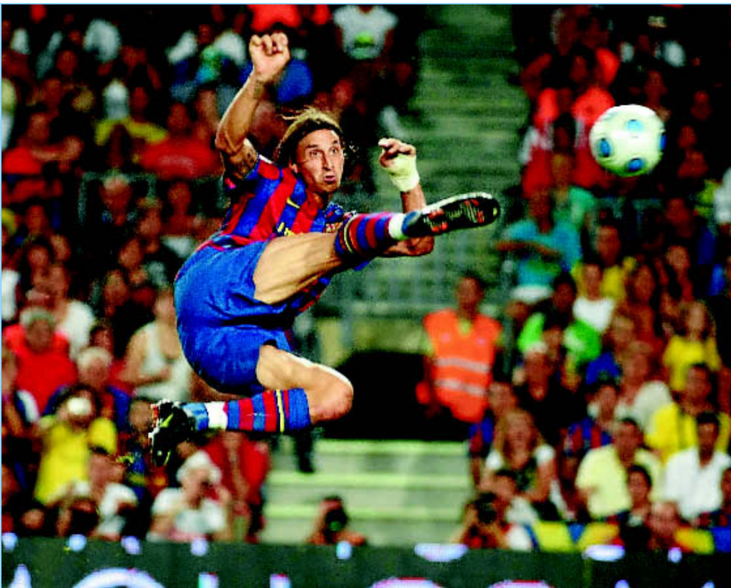
Ibrahimovic remató de esta espectacular manera a gol, pero el guardameta vasco evitó que entrara el balón